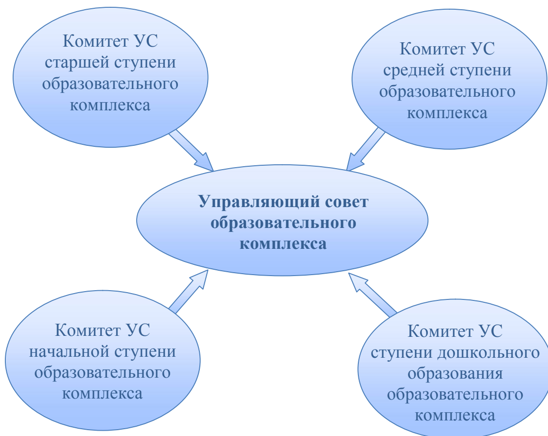
Рис.2. Управляющий совет образовательного комплекса. Второй вариант организации.

соответствующей ступени (структурного подразделения) – это вопрос открытый и ответ на него зависит от объема функций и полномочий комитета. То же самое можно сказать и в отношении «структурно-территориального» комитета, рассмотренного в первом варианте.